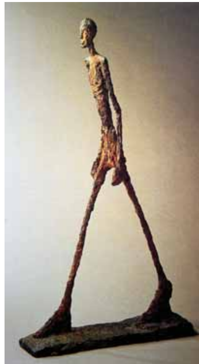
贾科梅蒂《行走的人》 伦敦苏富比 2010年 1.04亿美元

然而，尽管中国雕塑、装置市场中存在诸多困难与挑战，但并不妨碍它在国际艺术投资界、尤其在中国成为一支备受瞩目的“蓝筹股”。相反，更多的人从东西方雕塑市场悬殊的差距中看到了其非凡而巨大的价值评估潜力。在最近的几年中，中国政府加大了对文化艺术事业的扶植力度，出台了一系列相关的优惠政策，一批民营美术馆和非公募艺术基金如雨后春笋般蓬勃发展起来，从 2009 年到 2010 年 10 月不到两年的时间里，仅北京市就成立了北京华亚艺术基金会、北京民生文化艺术基金会等 5 家赞助文化艺术事业的基金机构。此外，由非营利艺术机构和美术馆主导的大型雕塑展览日渐