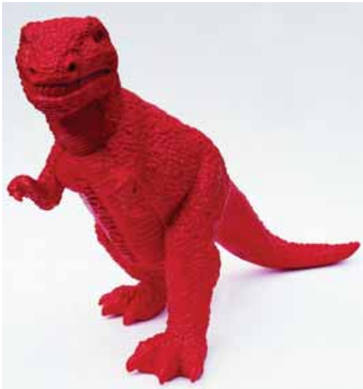
隋建国《中国制造》（艺术衍生品）