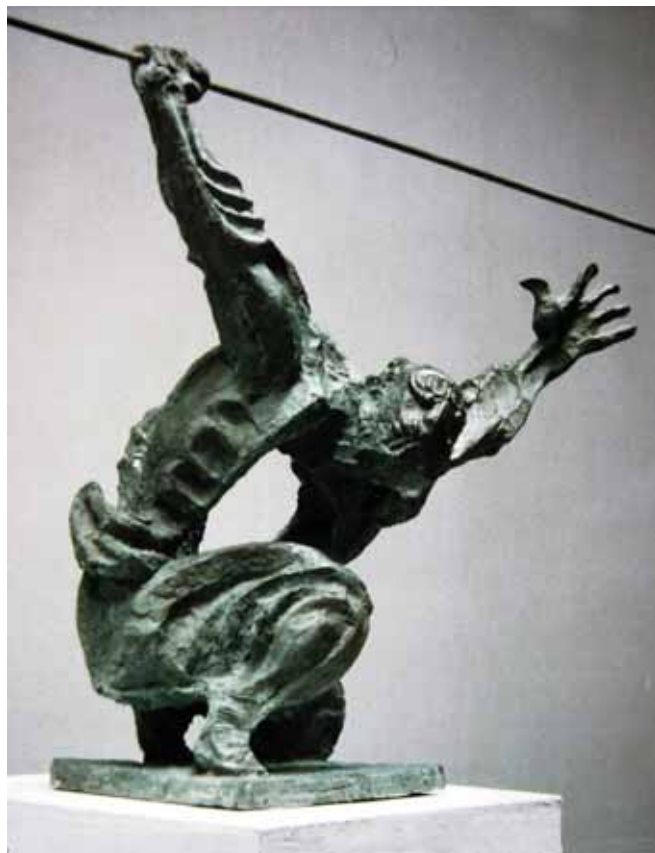
曾成钢《梁山好汉系列》2008年6月 西泠印社 128.8 万元 (RMB)

如今, 通过知识产权保护体系、艺术授权以及媒介的宣传引导, 艺术衍生产品逐渐被大众接受, 立体艺术的衍生品大可以作为建筑、景观设计, 小可以与礼品、玩具结合, 当下一些更加商业、多元的装置艺术品甚至还可以与娱乐业、展示业相结合, 例如由德