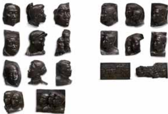
滑田友 人民英雄纪念碑浮雕《五四运动》创作稿 2010 年 中国嘉德 896 万元（RMB）

与此同时，国内投资者和专业收藏家们也开始越来越多地关注这一板块，2010 年秋拍中，中国雕塑拍卖市场有了明显的升温，中国嘉德推出了“中国雕塑系列专场——京津雕塑”专场，其中滑田友的人民英雄纪念碑浮雕《五四运动》创作稿（共十九件）以 896 万元的高价落槌。展望的《假山石 No. 131》在香港佳士得以 548.68 万元成交，刷新了他的个人拍卖纪录。他的另一件作品《坐着的女孩》估价为 55 万到 65 万元，最终以 235.2 万元的高价在瀚海拍出。向京的《暗示——为了无双》也在翰海以 103 万元拍出，而她的《空