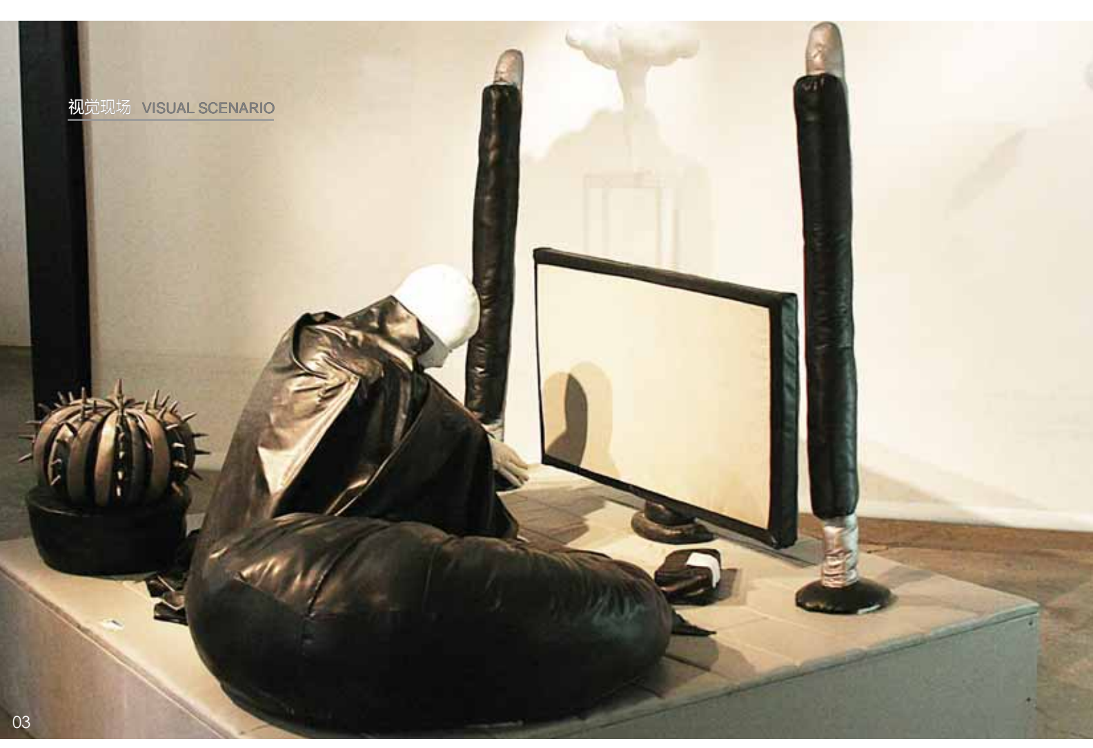
03 雪花 韩璐

源于某些男人和女人,源于他们的生命和作品,它们在几乎所有情况下都点燃着,并把光散射到他们在尘世所拥有的生命所及的全部范围"。