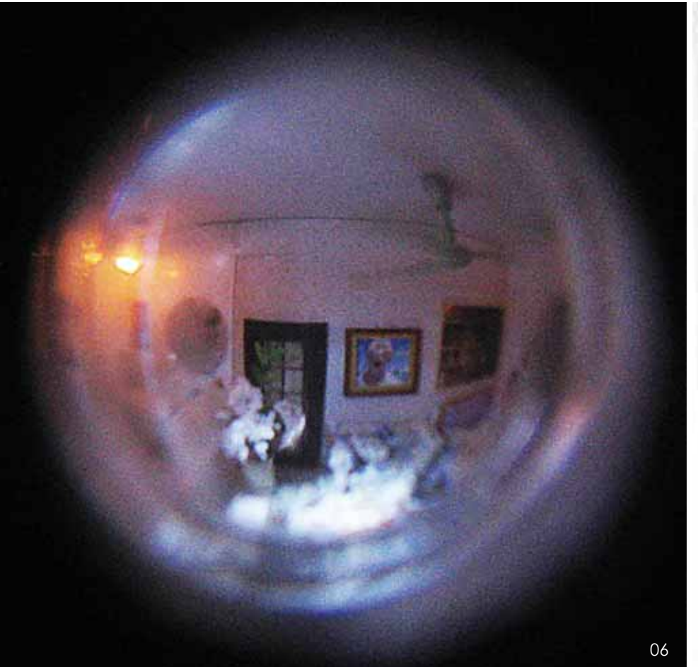
06 某年某月某时某分(猫眼内景) 岳艳娜 张显飞